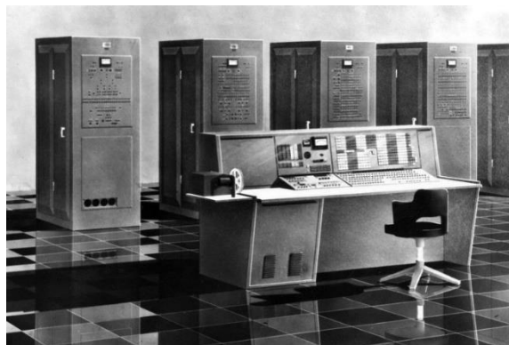
Ламповая ЭВМ М-100 - самая быстрая ЭВМ в мире того времени (сто тысяч операций в секунду).