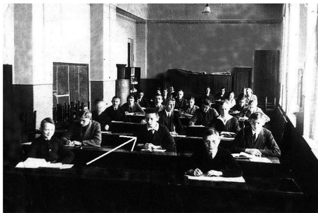
1924 год. Гимназист Конрад Цузе в центре второго ряда.

Конрад Цузе родился в Берлине (Германия) и продолжительное время жил с родителями на севере Саксонии в городке Хойерсверда (нем. Hoyerswerda). С детских лет мальчик проявлял интерес к конструированию. Ещё в школе он спроектировал действующую модель машины по размену монет и создавал проект города на 37 миллионов жителей. А в годы студенчества к нему впервые пришла идея создания автоматического программируемого вычислителя. Эти увлечения не мешали ему хорошо учиться и сдать экзамены на