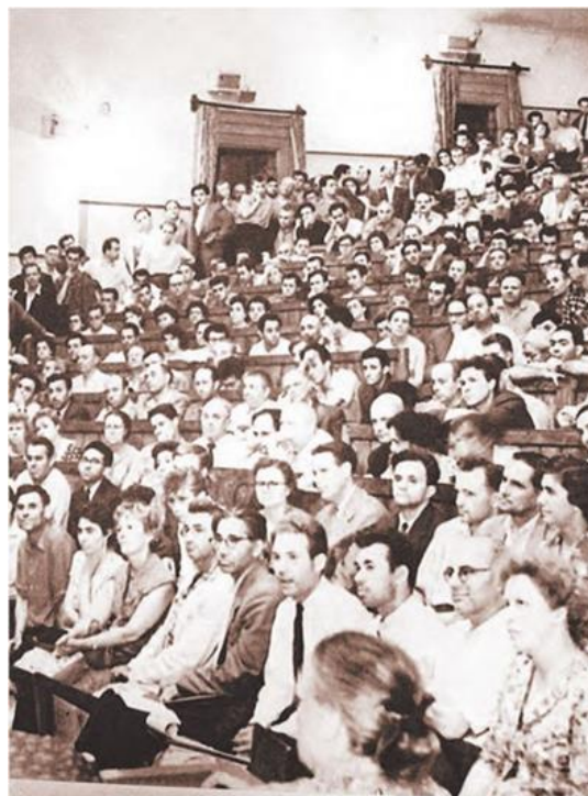
1954. На одной из первых лекций по кибернетике в Политехническом музее

Один из таких мифов – возможность создания в СССР сети типа интернета задолго до его появления в остальном мире, если бы руководство СССР отнеслось к идеям А.И. Китова более мудро. Не в последнюю очередь живучесть этого мифа питается восприятием компьютера как доступной практически всем игрушки. Сыграло свою роль и появление на этом фоне книги (Peters В., 2016), приведено много фактов о достижениях СССР в области вычислительной техники и последующем отставании. Об этом в последнее время написано так много, что оспаривать мнения и аргументы отдельных авторов нет смысла, но и полностью их игнорировать невозможно. Вопрос о причинах отставания нашей страны в этой области слишком важен. Он важен для будущего страны, а для многих из нас имеет еще и личное измерение, однако рассматривать его необходимо в широком контексте.